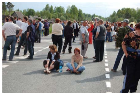
Работники градообразующих предприятий г. Пикалёво перекрыли трассу

Пикалёво – город в Ленинградской области, в котором проживает около 20 тыс. человек, – превратился в настоящую зону социального бедствия. В условиях кризиса были закрыты три градообразующих предприятия города: Пикалевский глиноземный завод, Пикалевский цемент и «Метаксим». В результате половина трудоспособ-